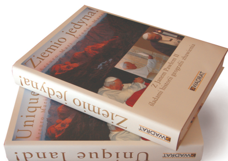
Przykład książek wydawnictwa Kwadrat wydrukowanych na papierze Garda

Dzięki wieloletniej współpracy z naszym partnerem w Polsce – firmą Papyrus – możemy pracować z prestiżowymi wydawcami i koncentrować się na szczególnie trudnych, a zarazem interesujących pozycjach, które stanowią punkt odniesienia dla innych wydawnictw. Przemysł wydawniczy to zamknięty krąg – jak rodzina, i nie ma w tym segmencie zbyt wielu rozpoznawalnych papierów. Dlatego tym bardziej jesteśmy dumni, że nasze produkty są częścią tej listy!