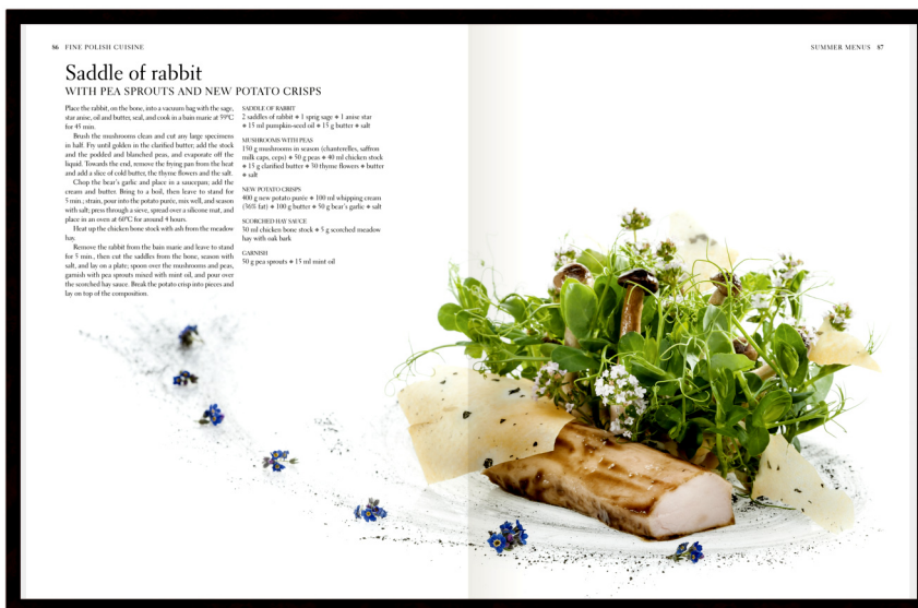
Jedna z rozkładówek Wykwintnej kuchni polskiej wydrukowanych na papierze GardaPat 13